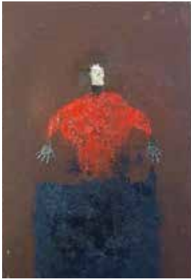
赤いセーター 1976 年