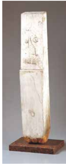
でくのぼろ 1977 年