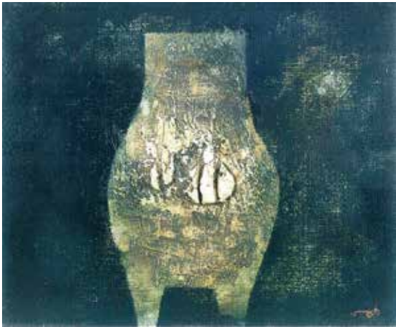
壺中 1975 年

本展は、当館の収蔵作品から油絵、オブジェ、デッサン 90 点に小田原市「すどう美術館」の貴重なコレクションから未公開作品など 20 点を加えた 110 点を紹介します。今もなお、脈々と生き続ける菅作品のユーモアとメッセージを、生誕 110 周年の新たなスタートとして展覧します。