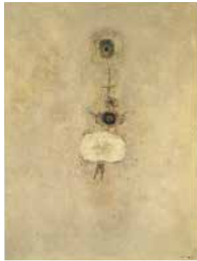
悦 1972 年