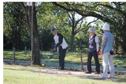
遊ゆうシニアスポーツ