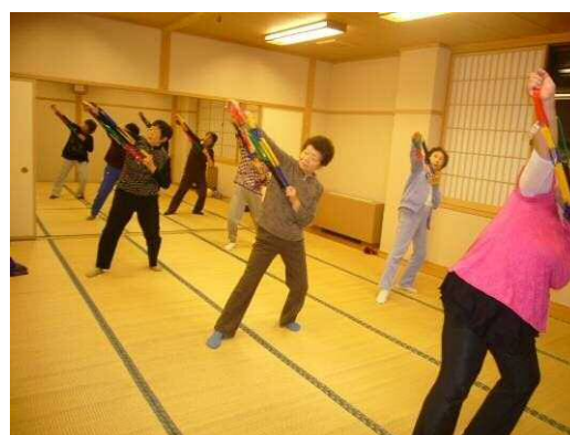
いきいき健康教室