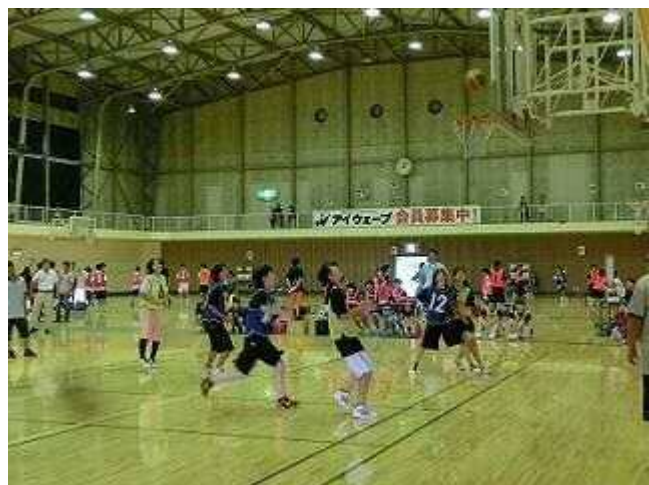
バスケットボール3×3大会