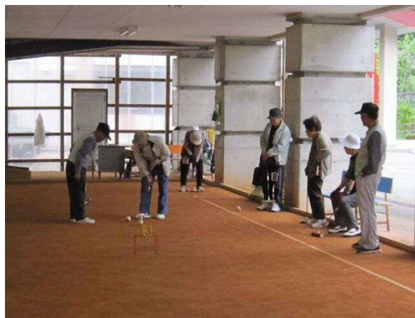
ゲートボール教室