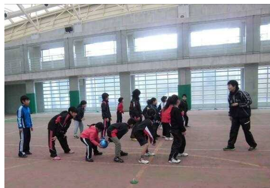
J o y 祭り 子どもの身体づくり教室