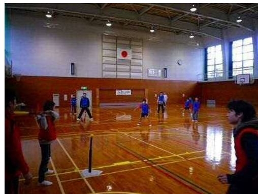
ニュースポーツフェスタ