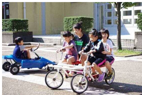
ふくみつスポーツデー