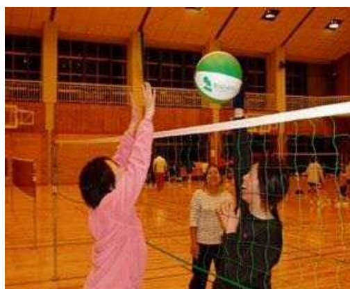
ビーチボール教室