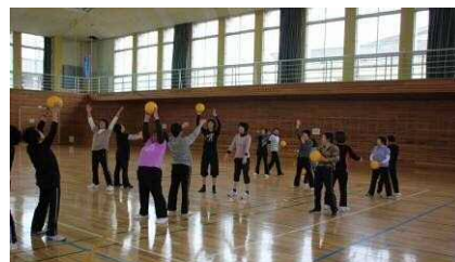
爽快エクササイズ（3B体操）