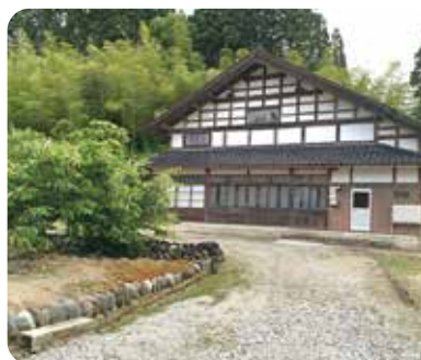
里山 ふとみやま 太美山体験ハウス