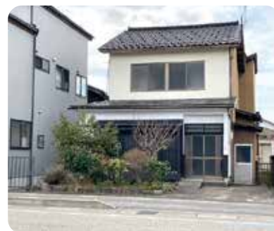
街なか じょうはな 城端体験ハウス