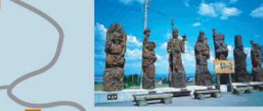
いなみ木彫りの里 井波彫刻をはじめ特産品などを多彩に楽しめ、味わい、くつろげる。