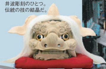
獅子頭は代表的な井波彫刻のひとつ。伝統の技の結晶だ。