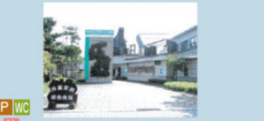
井波彫刻総合会館