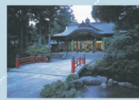
高瀬神社 延喜式神名帳に記載された越中一の宮。縁結びの神、福の神として知られ、初詣には数十万人が訪れる。