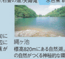
縄ヶ池 標高820mにある自然湖。ありのままの自然が作る神秘的な環境が魅力。