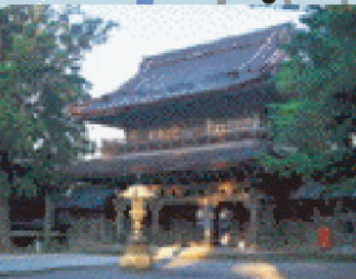
善徳寺 連如上人の開基から530年余りの古刹。本尊は行基作と伝えられる阿彌陀如来像。宝物収蔵館では貴重な古文書や宝物を見学できる。