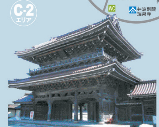
瑞泉寺 建立は明徳元年(1390)。井波彫刻発祥の寺とされ、山門や太子堂などに秀作逸品が今も残る。