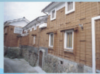
蔵回廊 明治中期建造の4つの土蔵を修復再生した歴史展示館