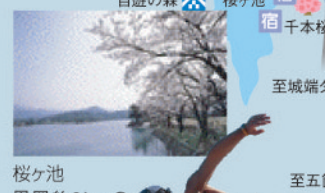
桜ヶ池 周囲約3kmの大人造湖。数千本の桜が満開となる春は絶景。 スケートパーク 初心者・上級者を問わずストリート系スポーツを楽しめる。