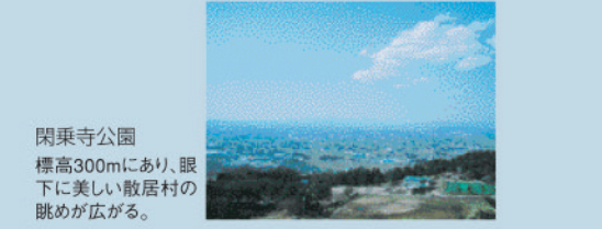
閑乗寺公園 標高300mにあり、眼下に美しい散居村の眺めが広がる。