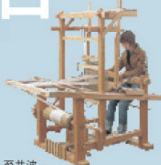
至井波 じょうはな織館 特産の絹織物の販売や、手織り体験が人気