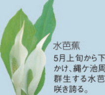
水芭蕉 5月上旬から下旬にかけて、縄ヶ池周辺に群生する水芭蕉が咲き誇る。