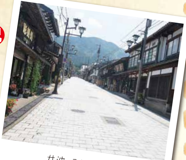
井波・八日町通り