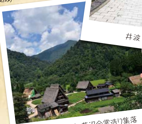
世界遺産五箇山 菅沼合掌造り集落