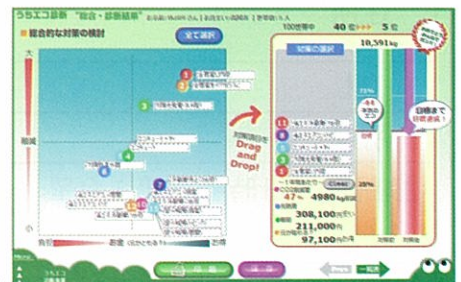
効果的な対策の提案