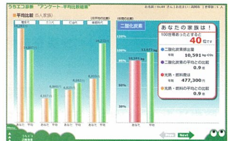
CO 2 排出量の平均比較とランキング