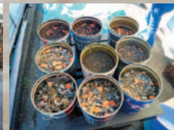
⑥分別した鉛散弾等を産業廃棄物として搬出(鉛は再資源化)