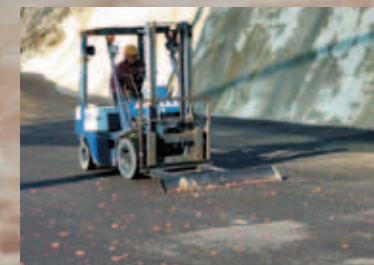
①機械による鉛散弾、クレー破片、薬莖等の回収

射撃愛好家の皆さまはもちろん、地域の皆さまからも愛される射撃場であるため、私たちは鉛散弾の飛散を防止するとともに、場内の鉛散弾、薬莖、クレー等を回収・分別して再資源化することに取り組んでいます。