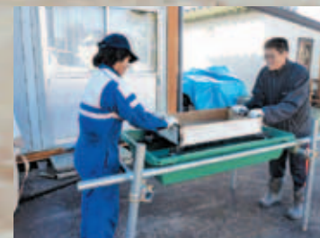
⑤回収した鉛散弾、クレー破片、薬莖を分別