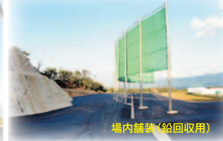
場内舗装(鉛回収用)