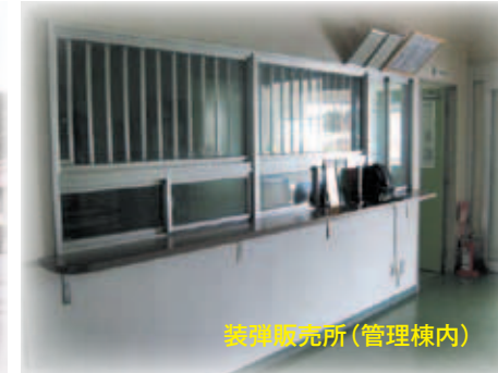
銃弾販売所(管理棟内)