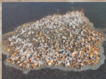
③集められた鉛散弾、クレー破片、薬莖等