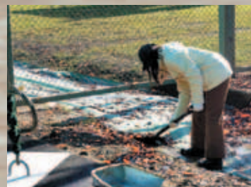
④手作業による回収