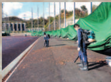
②ブロワーで残った鉛散弾を集積