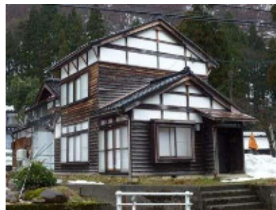
西赤尾体験ハウス