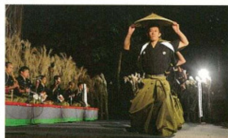
● 五箇山麦屋まつり (9月23・24日) 平家の落人が麦を刈る時に唄ったので麦屋節と伝えられ、紋付、 袴、白たすき、刀をたばさみ、笠を手に男社に舞うことにその昔 の平家の栄華が偲べれます。