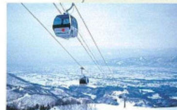
● IOX-AROSA (イオックスアローザ) スイスのリゾート「AROSA」と友好スキー場提携 を結んでおりヨーロッパの感覚が満喫できるスキー 場です。