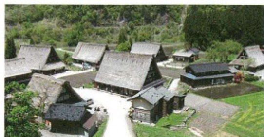
● 世界遺産 香沼合掌造り集落 平家の落人たちが住みついたとされている集落の一つ。昭和45年、国の史跡 に指定されて合掌造り集落の歴史を永久に残すことになりました。また、平 成6年に重要伝統的建造物群保存地区にも指定され、平成7年12月にユネスコ の世界文化遺産に登録されました。