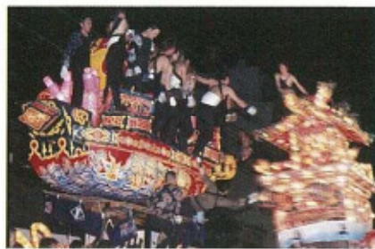
● 福野夜高祭 (5月1・2日) 350年以上の伝統を誇るあでやかな祭り。高さ7メートルにも 及ぶ豪華な行燈をかついで威勢よく町を練り回ります。