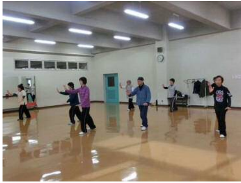
太極拳で大地を感じよう