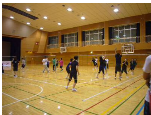
ビーチボールリーグ