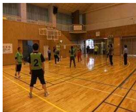
ビーチボール教室