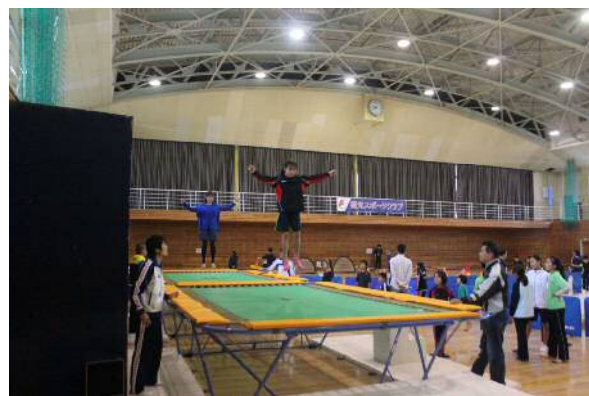
ふくみつスポーツデー