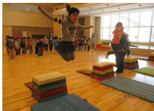
運動指導（跳び箱運動）