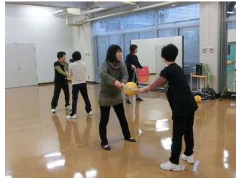
すこやかさん3B体操