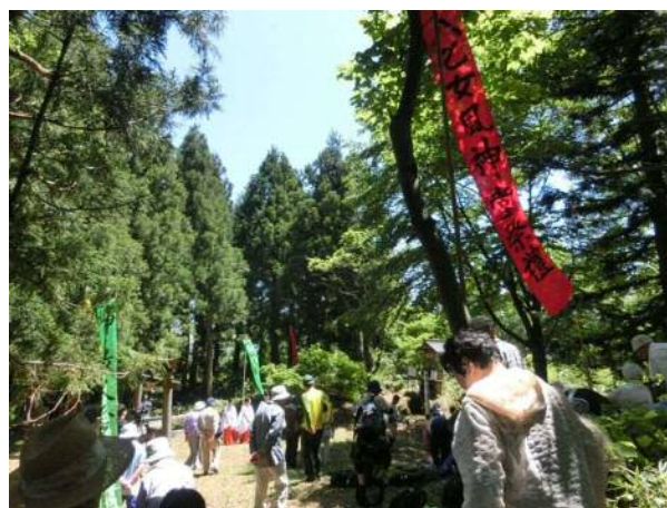
会員交流会（八乙女山ハイキング）