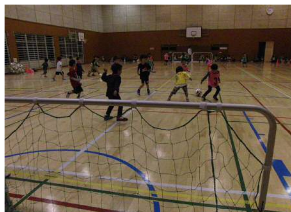
人気の「うんどうあそびサッカー」教室