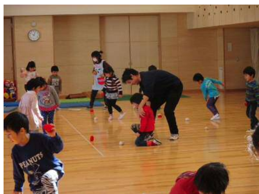
運動指導（投げる運動遊び）