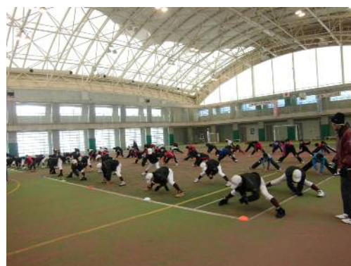
J o y 祭り 子どもの身体づくり教室