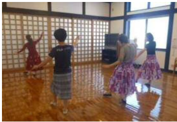
歌謡曲でフラダンス