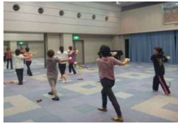
美姿勢エクササイズ