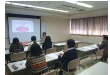
60代、人生の第2の幕開け