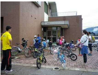
サイクリングに行こう