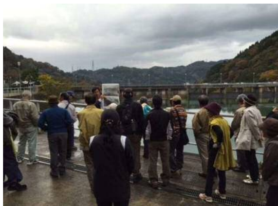
「ふるさと見聞シリーズ【後期】」