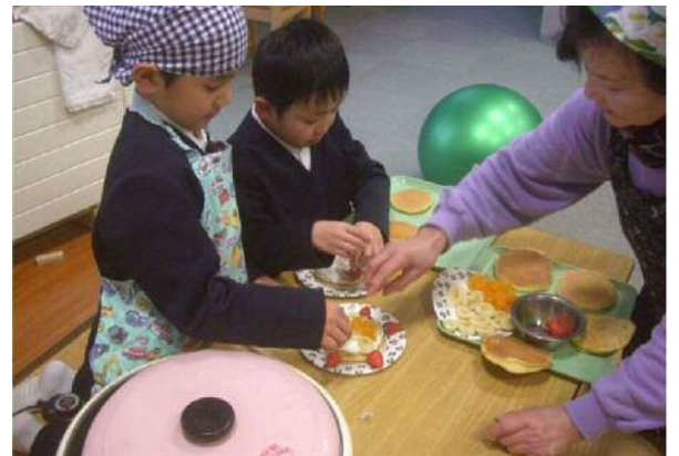
ホットケーキ作り