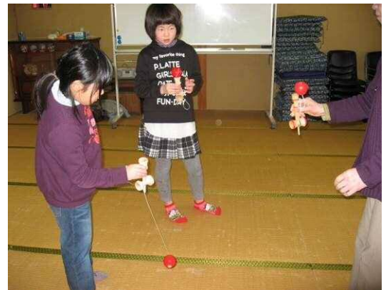
第4土曜【学習・体験活動】