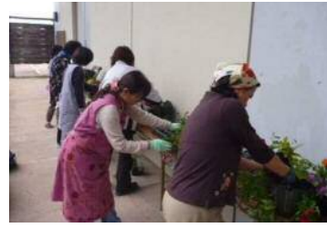
季節の寄せ植え教室