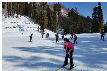
クロスカントリー教室

スキー教室では、クロスカントリースキー、アルペンスキーの練習を行っている。技術経験者や現役選手に指導いただいて、初心者から経験者までがレベルに応じた練習を行っている。また、冬季大会での入賞目指して練習に励んでいる。