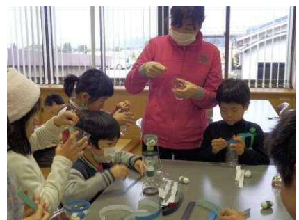
ペットボトルで剣玉づくり