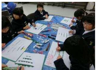
クリスマスカード