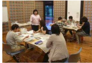
パステルで描くほっこりあったか