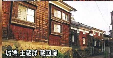
井波彫刻 城端 土蔵群 蔵回廊

運行期間 平成29年 10月1日(日)～平成30年 3月25日(日)までの 土・日・祝 運行