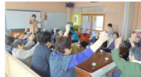
地域包括ケアシステム (住民主体のミニデイサービスでの軽運動)