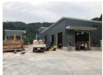
森林資源エコシステム (ベレット工場)