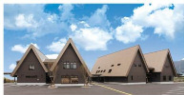
クリエイタープラザ (ブランド商品開発、クリエイターの拠点)