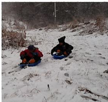
朝から雪が積もりそり滑り