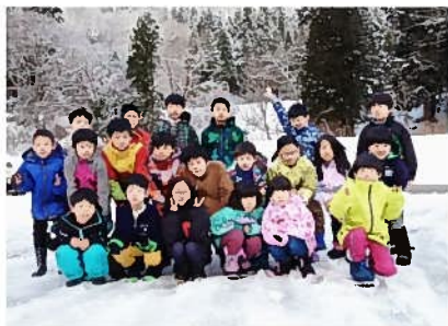
最終日、朝の集合写真