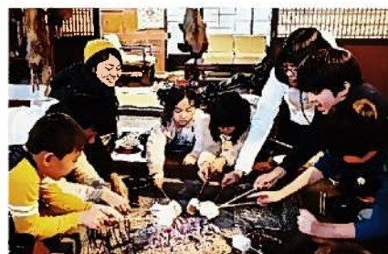
いろいろでおやつ