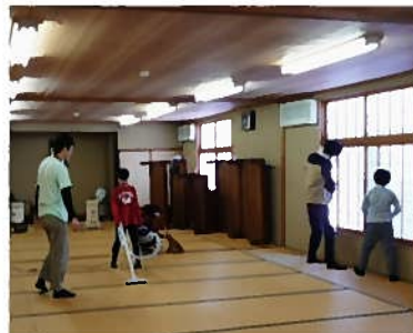
使用した部屋の掃除