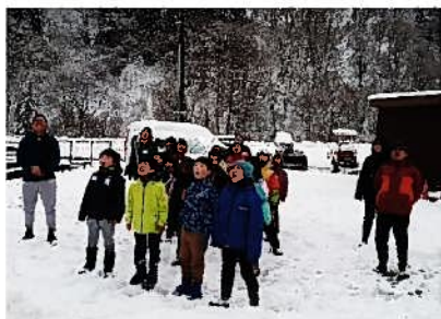
朝のつどい、やまびこ挨拶