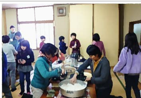
食事は、猪、鹿、熊、岩魚