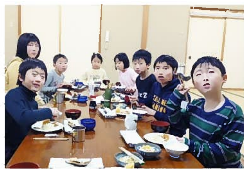
夕食、岩魚の天ぷらと猪汁