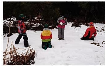
到着してすぐに雪遊び