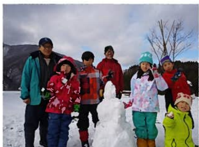
雪だるまをつくる