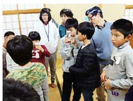
岩魚の孵化、生命の神秘にふれる