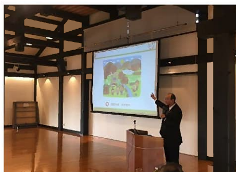
<市長・教育長と語る会>

日時: 令和元年11月23日(土) 16:00より 会場: いのくち椿館 内容: 市長演題「非認知スキルと子どもの権利」 教育長講演「令和の教育改革と未来像」 各単Pより市長、教育長への質疑応答