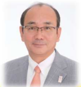
南砺市長 田中 幹夫

子どもに寄り添い、子どもの声を聞き、子どもと大人が一緒に考えて、取り組んでゆくことでよりよい南砺市をつくっていきましょう！