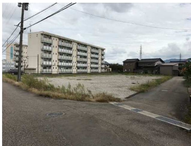
正面道路から撮影