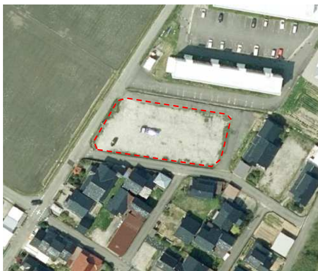
上空からの物件写真