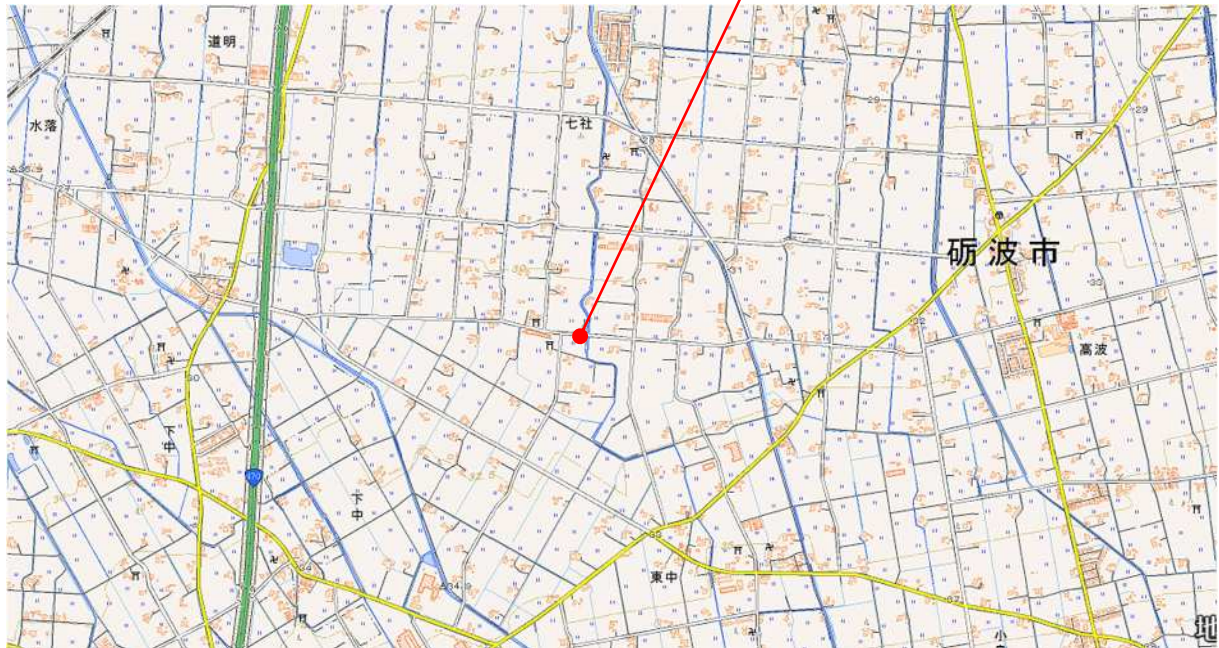
国土地理院地図（電子国土 Web）を加工

○インターネット地図（GoogleMap）での位置確認は https://goo.gl/maps/jEyzZuaauUv からご確認いただけます。