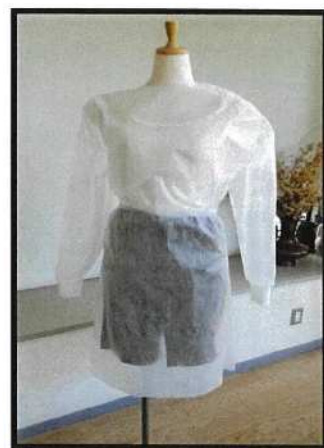
新分野へ進出・医療用ガウン (アイソレーションガウン) 長さ 約140cm