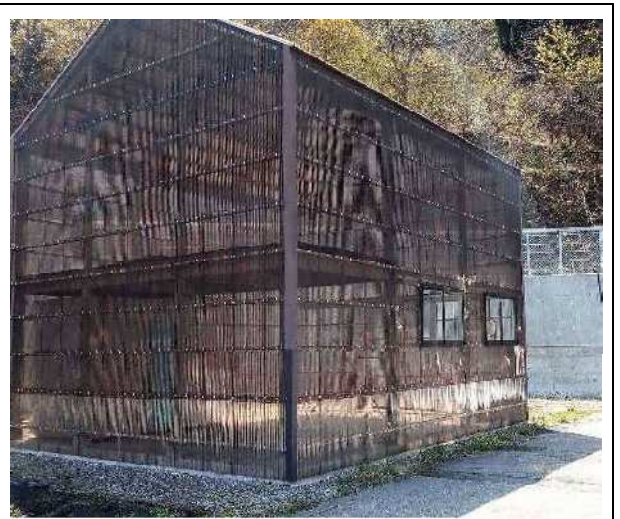
建物前面から撮影