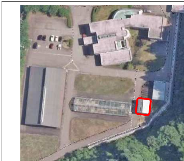
上空からの物件写真