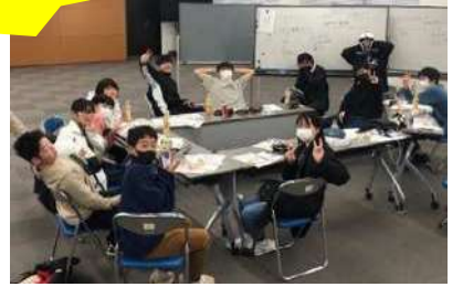
こども部会会議の様子