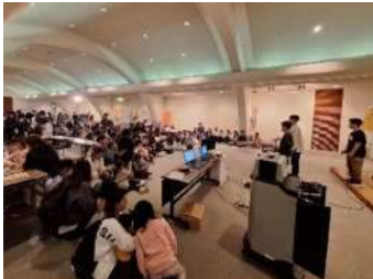
イベントは、準備から当日運営も自分たちで活動しました