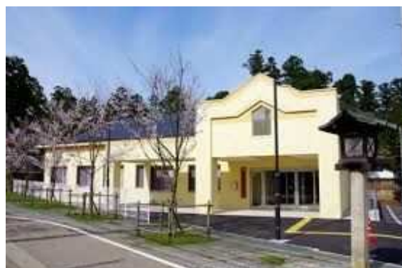
●城端児童館「さくらっこ」