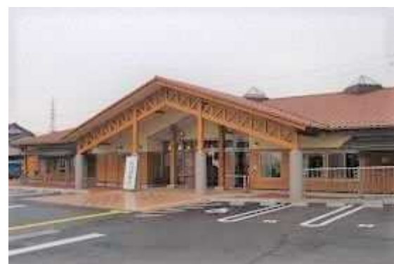
●福光児童館「きっずらんど」