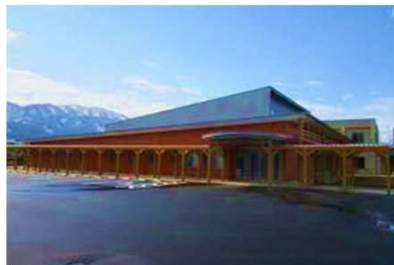
●井波児童館「きぼりっこ」