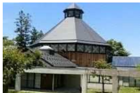
●福野児童センター「アルカス」