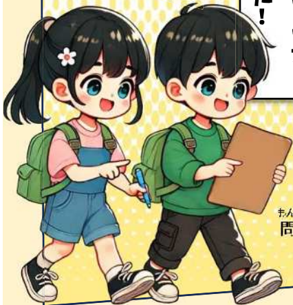
謎解きで 問題解決をする キミたち

なんとくんのボールを 集めるためには 学校に散りばめられた 謎を解かなければいけない。 キミの力が重要だ!