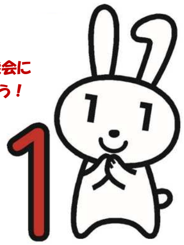
マイナンバーPR キャラクター マイナちゃん