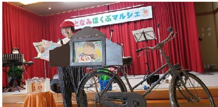
昔懐かしい紙芝居屋さん