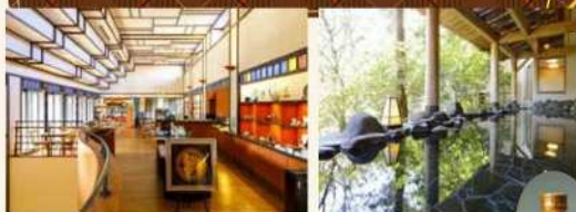
石川県九谷焼美術館