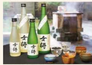
日本酒「女将」(あわら温泉女将の会)

越前がに漁解禁記念!あわら温泉・美食のまち坂井の魅力を感じ。11月29日(土)・30日(日)は新米すくいや、地元でしか味わえない酒まんじゅうの販売。30日(日)はあわら温泉でしか飲めないお酒「女将」の試飲も楽しんでいただけます。