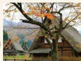
世界遺産 五箇山合掌造り集落