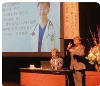
循環器内科医 刑部先生による講演