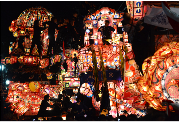
154. 新町との引き合い（横町）