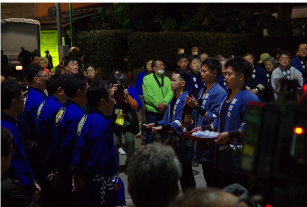
155. シャンシャン（横町）