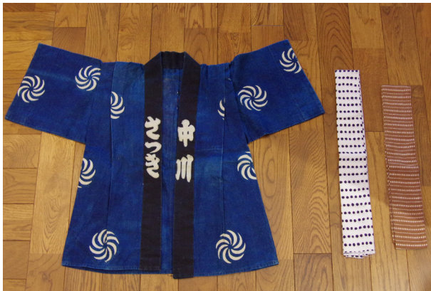
176. 子 S20 年代供用法被 中川恒家（御蔵町）

を担う。行燈の先頭には頑強な体の大きい若衆が曳き、最後尾には重し役一、二人が上に乗り、前を上げるようにする。OBも一〇人ほど参加し、四人は法被に黄の腕章を付けて誘導灯を持ち、行燈練り廻しの安全を計る。