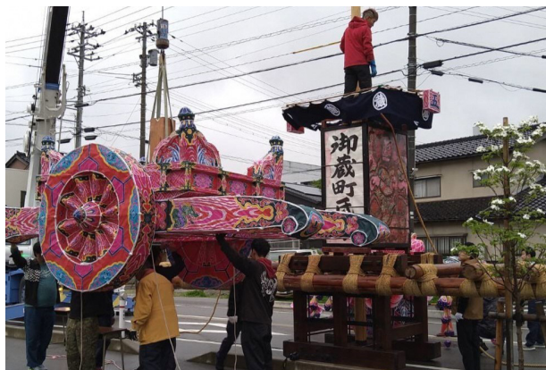
166. 行燈の組立（御蔵町）

その後令和元年（二〇一九）から大行燈にLEDを使用し、令和四年（二〇二二）すべてLEDになった。LEDは光を一方に向けて明るくする。蠟燭の揺らぎや広がりのある光にするため、小さなLEDをまとめて広がるようにしたり、種類を研究したりしている。行燈は全体的に明るくなり、バッテリーが一八個から五個に減った。