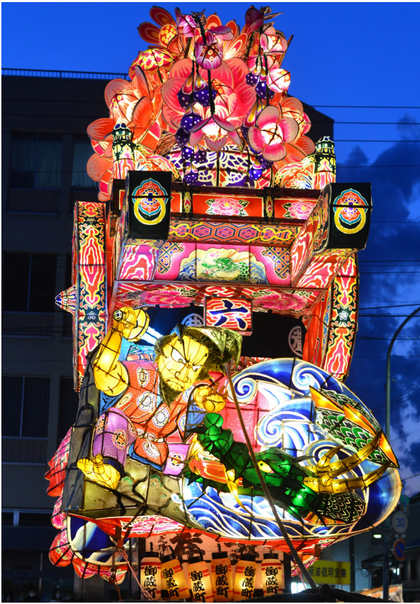
168. 行燈の意匠（御蔵町）

山車は大正期に屋形船、戦後は弁慶、花籠、鯉の滝登り、御座船などと変遷してきたが、昭和四九年（一九七四）からは花車である。吊物は昭和二〇年代に瓢箪、勸進帳巻物、鯉、鳳凰であり、昭和三〇年代からは、鳳凰と鯉から、鳳凰と天女になった。平成になり、鳳凰と火焰軍配となり、