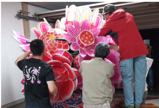
165. 花組の飾付(御蔵町)

八、化粧縄を前後左右四隅に丁文字に巻く。化粧縄をするのは平成一二年(二〇〇〇)以降である 九、台締め終了後、若衆がホースで水を縄全体にかけ、縄を締める。 一〇、裁許二人が行燈に向かって立ち、後ろには若衆が立つ。裁許が台の四隅に塩を盛って裁許長が酒をかけて清める。これを「お清め」という。全員で二礼二拍手一礼する。裁許長から酒を回し飲みし、最後の若衆が酒を裁許長の前へ持参し、礼をして下に置く。全員行燈に一礼する。