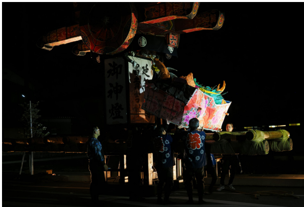
175. 行燈の解体（御蔵町）