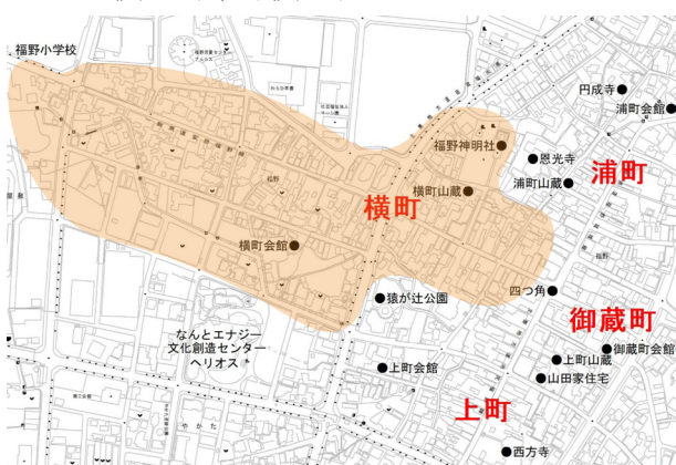
図 19. 横町位置図