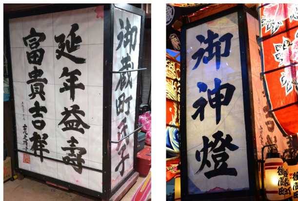
167. 田楽の文字（御蔵町）