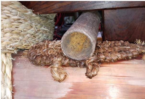
164. 草鞋を入れる(御蔵町)