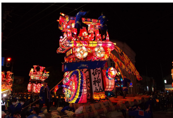
152. 行燈の練り廻し（横町）