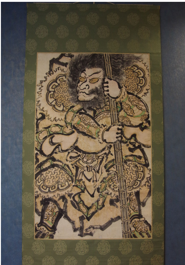
177. 中川恒家 田楽武者絵（御蔵町）