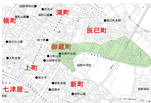
図 22. 御蔵町位置図

る「御蔵町通り」を境に、南が上町、北が浦町の地番も有するという関係から、引き合いをしない唯一の町内である。引き合いをしないため、行燈の優美さを競い、夜高行燈優美コンクールでは、何度も一等賞を受賞している。