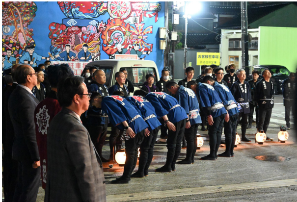
174. シャンシャン（御蔵町）