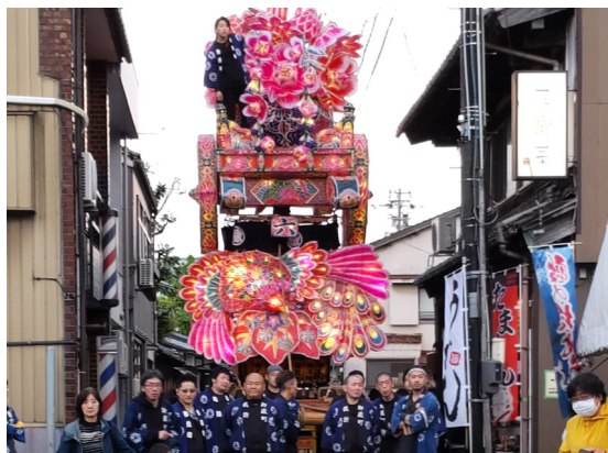
172. 行燈の練り廻し（御蔵町）