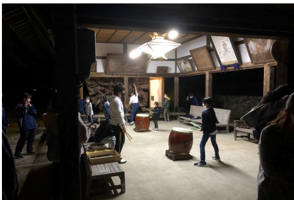
147. 夜高太鼓の練習（横町）