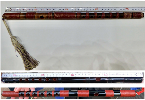
16. 新月製作の笛（上）各町の笛（下）