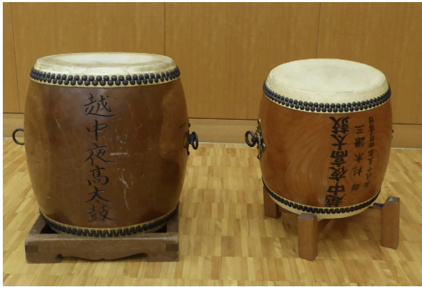
14. 夜高太鼓（長胴鉾留め太鼓）