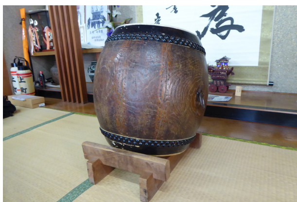
6. 「嘉永六年戸出村」とある上町の太鼓

現存する太鼓として古いものに、「嘉永六年戸出村」と胴内に書かれた上町の夜高太鼓がある。嘉永六年は一八五三年で、戸出（といで）村は現高岡市戸出町である。ケヤキの胴の手彫りで、昭和五〇年（一九七五）に石川県松任市（現白山市）の浅野太鼓で修復した際に判明した（写真6）。鼓面径四一センチメートル、高さ五二センチメートルの大きさである。『船鉾』には、「嘉永六年（一八五三）の作とすれば、昭和五〇年より起算して、百二二年の歳月を経ていることとなり、上町裁許相談の