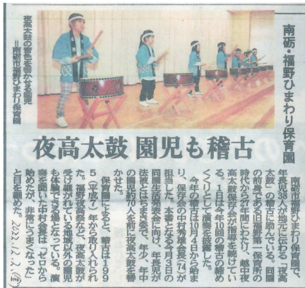
資料 2. 富山新聞 2022. 12. 2 記事

夜高祭の際の特設ステージでの演奏（写真17）をはじめ、商工会の商工まつり、福野町観光祭、福野町芸能祭、福野神明社三五〇周年事業、敬老会、結婚式といった大小様々な行事への参加が見られる、また、町外では、香川県多度津町への親善訪問、東京銀座まつりでの大行進（昭和四八年）、置県一〇〇周年記念「富山大曳山まつり」への参加（昭和五八年）、テレビ出演、夜高祭観光出向宣伝、国民文化祭（平成八年、二三年、二五年）、とやま国体（平成二二年）、夜高祭御分霊お迎え行事、夜高祭三五〇周年記念「伊勢神宮崇敬参拝」（平成一三年）、上海国際博覧会「富山県の日」での披露（平成二二年）、フランス・リヨン市の「光の祭典」への招待参加（平成二三年）、福島県南相馬市に震災支援遠征（平成二五年）、伊勢神宮式年遷宮記念事業（平成二五年）など、県内外はじめ国際的な活動がみられ、夜高祭の広報や夜高太鼓の交流、普及活動に貢献している。