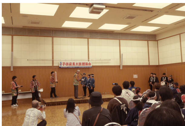
21. 夜高太鼓競演会 表彰式