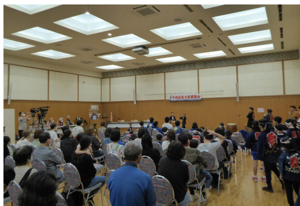
18. 夜高太鼓競演会 全体