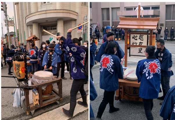
9. 御蔵町（左）. 浦町（右）

もと、我が福野町に行燈太鼓は数多くあれど、これだけの歴史ある太鼓はただ一つ上町行燈太鼓のみであろうと、新たに認識した。歴史的祭礼遺産として、胴の割れ目等を漆で塗り詰め杉原満曳山大工で補修をして、以後、管理に意を尽くすように後継者に申し伝える」とある（七四頁）。 現在の夜高太鼓は、一つの長胴鉾留め太鼓を太鼓台車の上に縦に置き、大バチと小バチの二人で鼓面を打つ形をとっている。昭和四五年（二九七〇）発行の長岡一忠著『福野の夜高あんどん雑考』には、「越中夜高太鼓打ち」（三九頁）とされた筈、太鼓の写真が掲載されているが、四角の木枠の上に太鼓を乗せ、片面を二人の奏者が桴を振り下ろす形で打っており、ここに現在の祖型を確認することができる（写真7）。なお、写真7では、桴が大きく写されているが、夜高太鼓では桴は用いられず、練習用と推測される。 このような奏法は、昭和から平成にかけて次第にできあがってきた