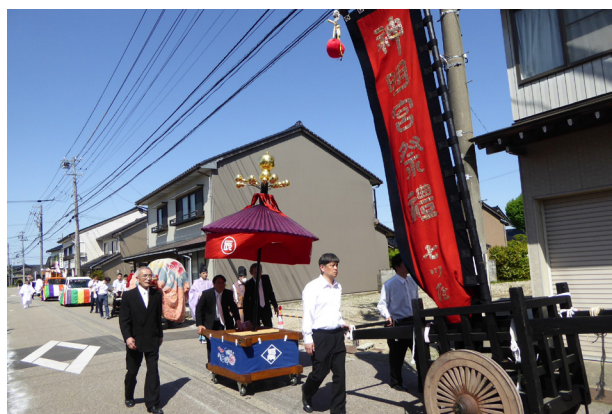
4. 神輿渡御 (R6)

とある家の前にくると、「ホォー」の掛け声を合図に太鼓の乱打と笛の高音を伴い獅子が舞い込む。次いで、神官による祓いの後、拍子木が入り、神輿の鈴が振られる。これらの笛や太鼓、拍子木や鈴の音、各町内を巡る曳山の軋み音が遠く近く、福野の街空間に響き渡る。