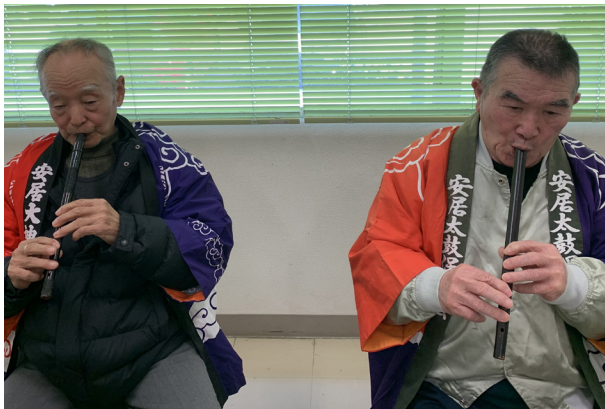
13. 安居大神楽太鼓の演奏