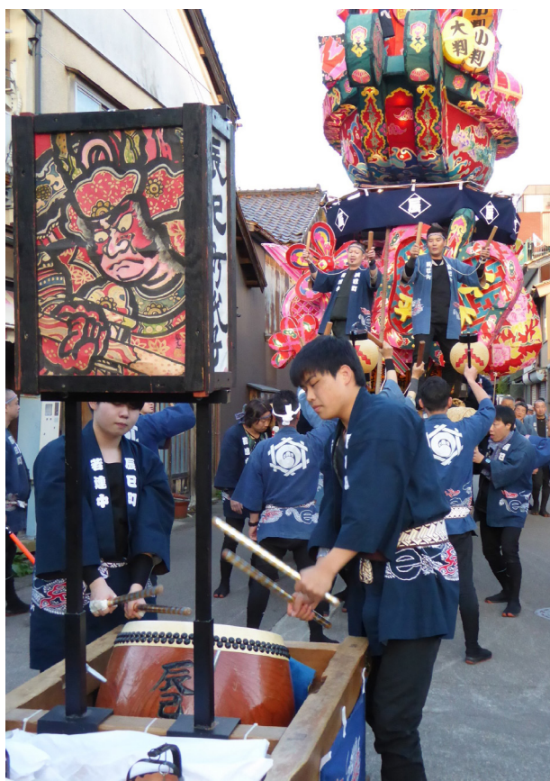
5. 行燈を先導する夜高太鼓（辰巳町）

夜高行燈と夜高太鼓の由来として語り継がれていることに、慶安五年（一六五二）の旧暦四月一日に伊勢神宮より分霊を受けた帰り道、俱利伽羅峠にさしかかったときには既に夜になってしまったことから、福野の人びとが太鼓を先頭に手に手に明かりを持ってお迎えに出たとある。太鼓は、もとより御神灯の点る行燈を先導し、先触れとして音によりその行く手を示したものとされる。従って、夜高太鼓は、行燈練り廻しの先導役としてなくてはならないものであり、行燈とともにあった。このような夜高太鼓の基本的な形態は現在も引き継がれており、行燈の行く手を導く夜高太鼓のリズムと音色、奏者のパフォーマンスは、祭の彩りと音世界に欠かせないものとなってきた（写真5）。