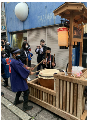
10. 七津屋（左）. 上町（右）

もと、我が福野町に行燈太鼓は数多くあれど、これだけの歴史ある太鼓はただ一つ上町行燈太鼓のみであろうと、新たに認識した。歴史的祭礼遺産として、胴の割れ目等を漆で塗り詰め杉原満曳山大工で補修をして、以後、管理に意を尽くすように後継者に申し伝える」とある（七四頁）。 現在の夜高太鼓は、一つの長胴鉾留め太鼓を太鼓台車の上に縦に置き、大バチと小バチの二人で鼓面を打つ形をとっている。昭和四五年（二九七〇）発行の長岡一忠著『福野の夜高あんどん雑考』には、「越中夜高太鼓打ち」（三九頁）とされた筈、太鼓の写真が掲載されているが、四角の木枠の上に太鼓を乗せ、片面を二人の奏者が桴を振り下ろす形で打っており、ここに現在の祖型を確認することができる（写真7）。なお、写真7では、桴が大きく写されているが、夜高太鼓では桴は用いられず、練習用と推測される。 このような奏法は、昭和から平成にかけて次第にできあがってきた