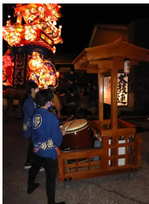
11. 横町（左）. 新町（右）