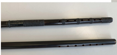
12. 安居大神楽太鼓の縦笛