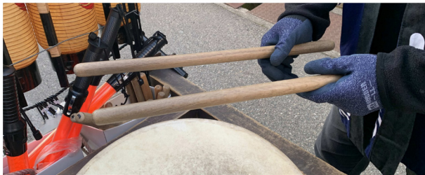
15. 夜高太鼓使用の桴（御蔵町）

はない。祭りの太鼓は時に小バチの奏者が交替せずに担当したり、大バチの奏者が即興も交えて、自分流を叩いたりする。