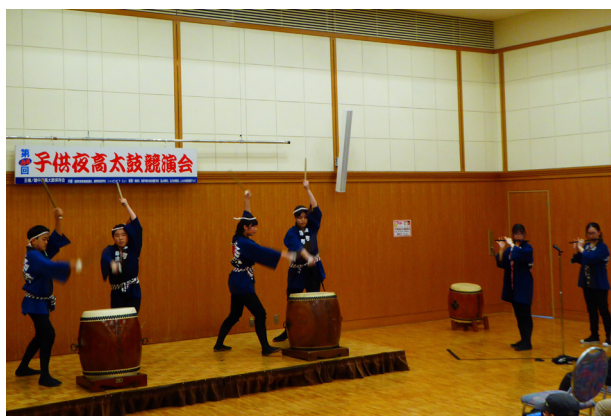
20. 夜高太鼓競演会 そろい打ちの部