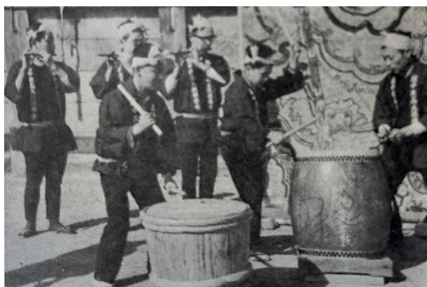
7. 夜高太鼓（『福野の夜高あんどん雑考』）