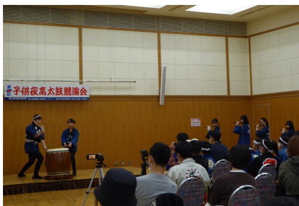
19. 夜高太鼓競演会 ペアの部

で審査対象となる演技が終了する。なお、そろい打ちの部は、二つの太鼓を二人ずつのペアで打つもので、祭りの太鼓とは異なり、基本となる打ち方に創意工夫を加え、笛の節との関係や太鼓のリズムの組合せを変化させたり、個々の打ち手の技能や合わせ方の妙味、掛け声のかけ方を工夫したりして、個性的で見応えのあるステージ用の太鼓となっている。