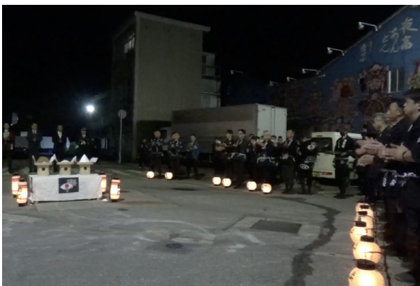
2. シャンシャンの儀 (R5)