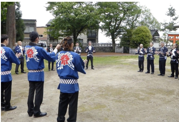
1. シャンシャンの練習 (R6)

深夜、当番裁許の進行によりシャンシャンの儀が粛々と執り行われ、手締めで行燈練り廻しに関する一連の動きが終了する（写真2）。なお、手締めのシャンシャンであるが、その打ち方は、当番裁許となる町による。