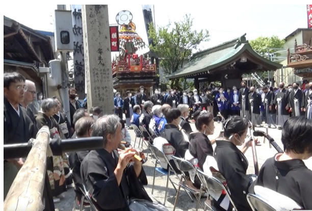
3. 神社鳥居前での庵唄奉納 (R4)

一二時三〇分より神幸祭があり、その後、神輿渡御となる。塩で清められた道を、大旗（神明宮祭禮）―辰巳町傘鉾―四神旗―獅子―先ぶれの太鼓（笛・太鼓）―楽（笛・太鼓）―神輿の列が終日街を巡る（写真4）。なお、令和六年（二〇二四）、四神旗は出ていない。「御小休所」