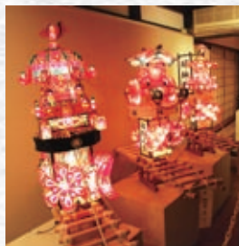
ギャラリー市の里で展示されるミニあんどん

1月11日(火)の開講に向け、福野ミニあんどん製作教室の受講者を募集しております。福野夜高祭のシンボルである夜高行燈の七分の一サイズのミニチュアを、約4カ月かけて制作します。