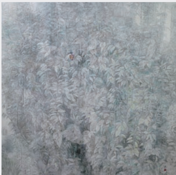
しょうようじゅ 題名「照葉樹」