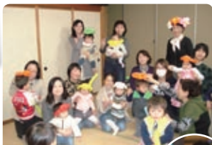
保育の出前教室。皆で バルーンアートをしました。