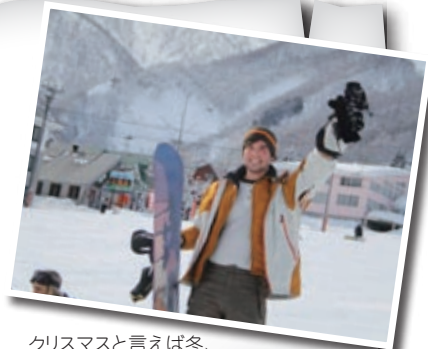
クリスマスと言えば冬、冬と言えば雪、雪と言えばスノーボード!

みなさんも、旅行や休養など、クリスマスと新年を元気で楽しく過ごしてください! Merry Christmas and a Happy New Year to all!