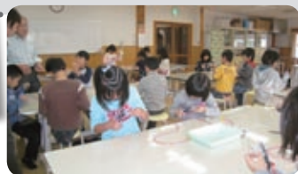
「チャレンジ科学」で聴診器を作りました。 心臓の音が聞こえたよ!

少しの間子どもを預かって欲しいとき、研修を受けた保育サポーターが、1時間600円でお預かりします。「アルカス」または「きっずらんど」まで印鑑を持ってお越しください。(ご利用の方は事前にお申し込みください。)保育サポーターも募集中です。なお、「とやまっ子育て応援券」も利用できますので、ご相談ください。