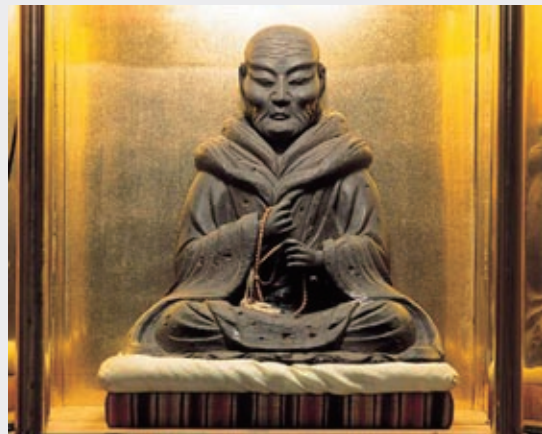
もく ぞう しん らん しょう にん ざ ぞう 「木造親鸞聖人座像」