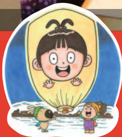
なんと みらい ちゃん (ふくみつ雪あかり祭りバージョン)

福野地域の成人式会場に届いた過去の自分からの手紙 過去と現在がつながり未来へと踏み出す門出の時