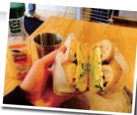
大好物であるアメリカのベーグル

初めて日本に住んでみて、最初は慣れないことがたくさんありました。なのでアメリカに帰ればとても落ち着くだろうと思い、ワクワクした気分で帰国したのですが、「やっと