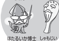
ほたるいか博士 シャもじい