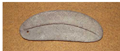
石鋸形石器 全長 15.6cm 重さ 260g