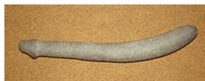
石棒 全長 29.4cm 重さ 578g