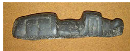
御物石器 全長 42.6cm 重さ 3,540g

いずれも詳しい出土地は不明ですが、高瀬神社の周辺と推定され、地域の特色をよく示す貴重な資料です。