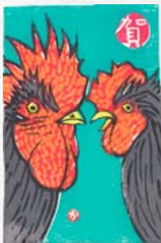
一般の部 大賞作品