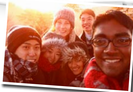
今年もよろしくお願いします!

話す言語が変わると少し性格も変わるのではないかと思います。言語には文化、習慣、ボディーランゲージなども含まれ、いつもの自分と変わった部分が出てくるので、やはり知り合いにはあまり見せたくないですね。しかし、言葉を習得することは元々難しく、「気まずい」という気持ちが先に立つとさらに習得が困難になります。「気まずい」という気持ちは捨てて日本語でも英語でも何でもみんなで頑張りましょう!