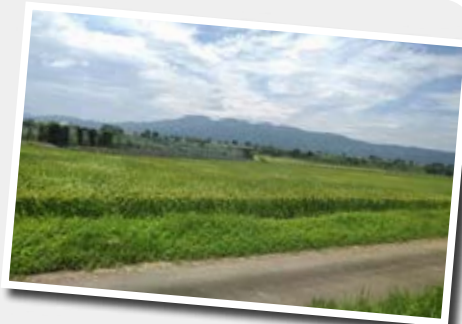
美しい景色が 当たり前のことになりませんように

人が優しく、眺めもきれいで、伝統文化も豊かで南砺市はとても素敵な所だと思います。これから世界のみんなに南砺の素晴らしさを知ってもらえるように国際交流員として頑張ります！