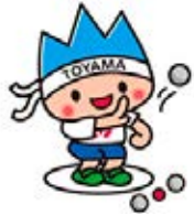
ねんりんピック富山2018 マスコットきときとくん