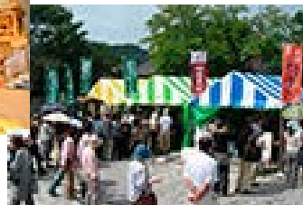
飛騨新そばまつり