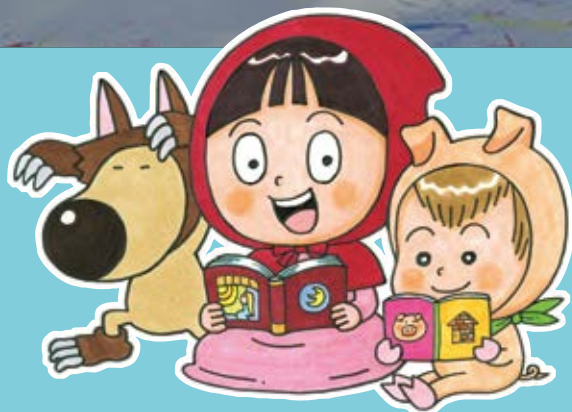
なんと みらい ちゃん (読書の秋バージョン)

南砺市ホームページ http://www.city.nanto.toyama.jp なんとくん(南砺市)フェイスブック https://www.facebook.com/NantoCity