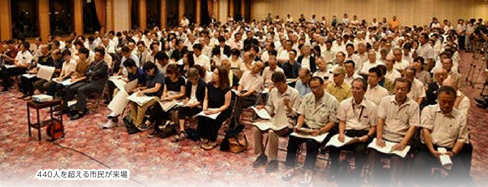
440人を超える市民が来場