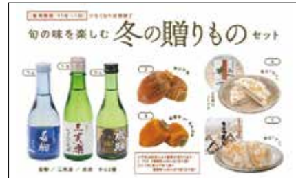
ギフトボックス一例：「冬の贈り物セット」5,000円(税込)

南砺ブランド商品をご紹介します。「南砺の逸品」公式サイトでは、南砺産の美味しい品々を集めた6種のギフトボックスを販売しています。お好みに組合せが選べるこのギフトボックスは、WEB限定商品で送料無料です。もらった人はもちろん、贈った人も幸せを感じる南砺の贈り物のお求めは、「南砺の逸品」公式サイトからどうぞ。 https://www.nanto.ippin.jp/ 南砺の逸品 🔍 検索 問い合わせ 商工企業立地課 ☎23 2018