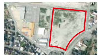
新たな拠点づくりの検討エリア（赤枠内）