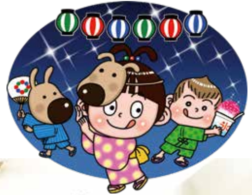
なんと みらい ちゃん (夏祭りバージョン)