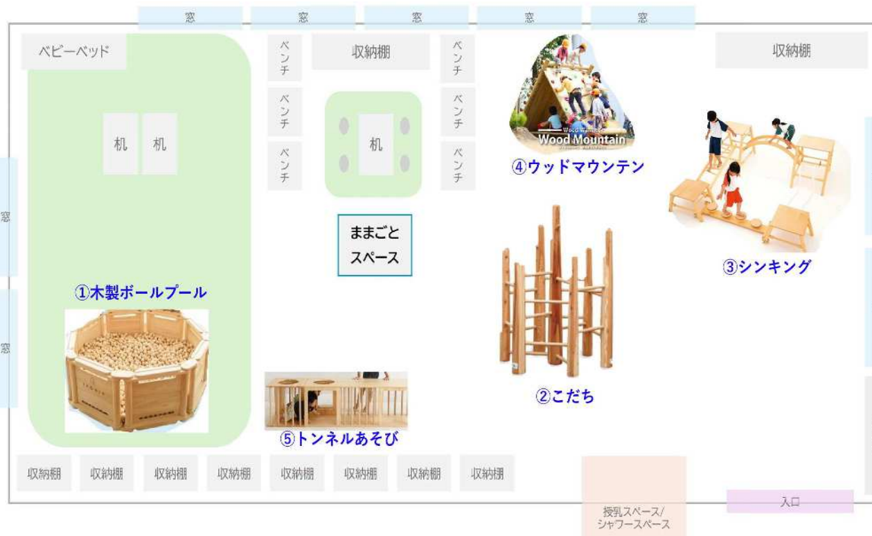
福光児童館 子育て支援室 (A=110.0㎡)